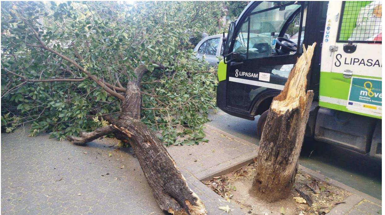
Imagen: LJA 316