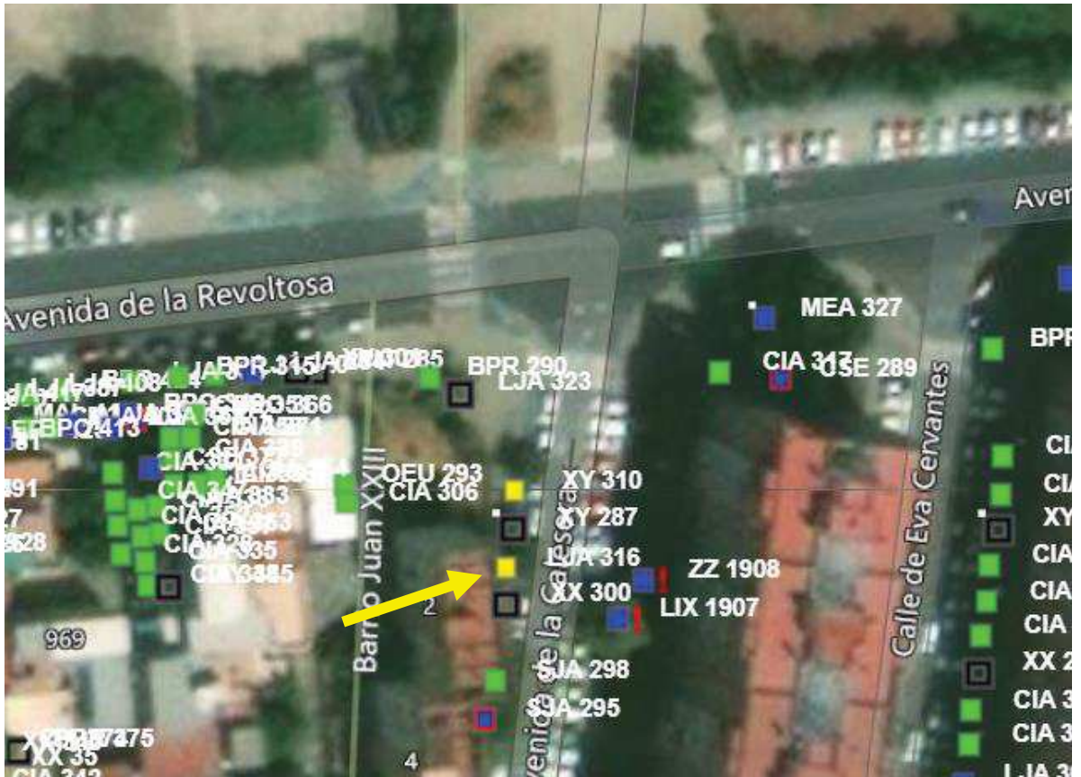
Imagen: LJA 316