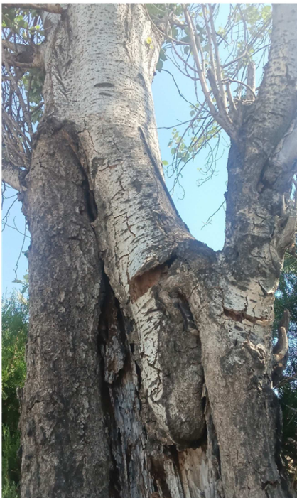
Cavidad con pudrición activa y madera de herida plenamente y repetidamente rebasada.