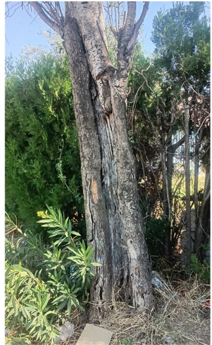
Amplia cavidad desde el cuello hasta la cruz, con pérdida de sección que supera el 80%.