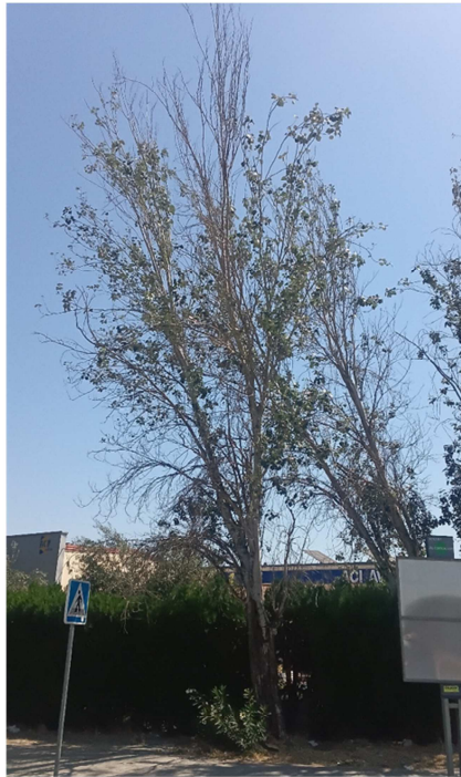
Vista general: árbol desvitalizado y ligeramente inclinado con aproximadamente el 30% de la copa seca.