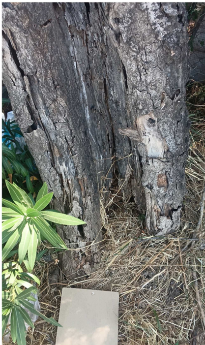
Izquierda hongos descomponedores de la madera e insectos perforadores. Derecha cirros anaranjados de Cytospora chrysosperma -chancro del álamo-.