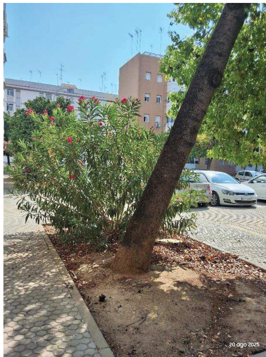
Imagen: BRX 104215.