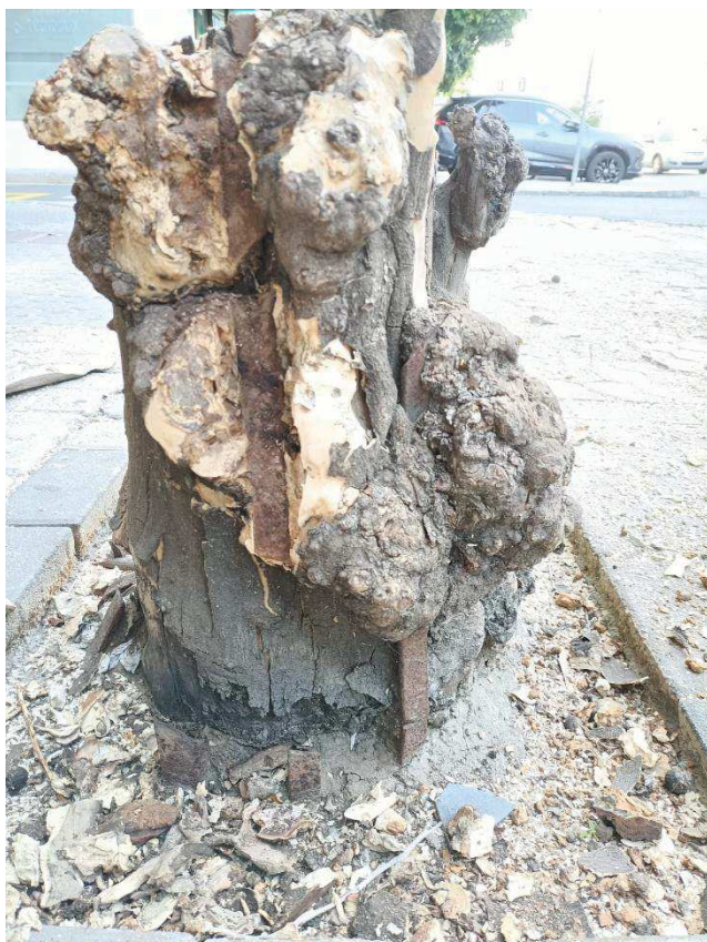
Imagen: ejemplar seco (1 y 2), barras de hierro asimiladas por el tronco (3).