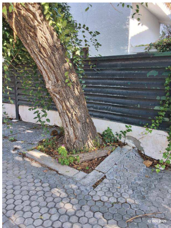
Imagen: Detalle del ejemplar (1) y de la base interfiriendo sobre muro de vivienda (2).