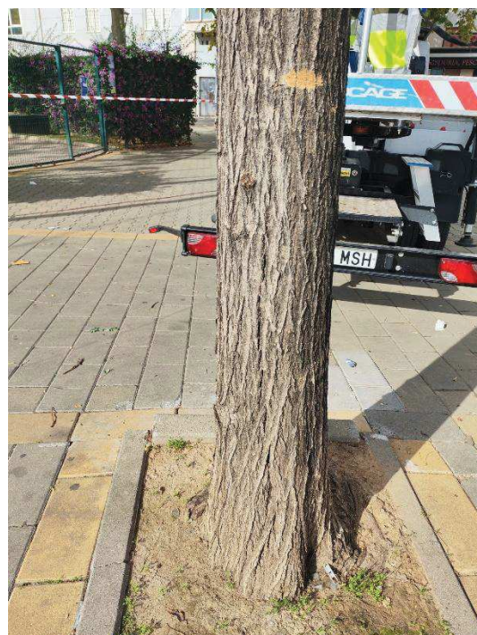
Imagen: detalle árbol completo (1) y lesión en el fuste (2).