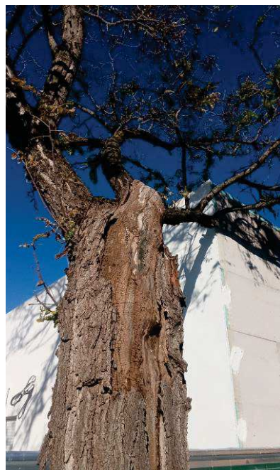
Desvitalización. Importante herida longitudinal en la parte a tensión del tronco desde el cuello hasta la base de las ramas primarias con madera vista y pudrición.