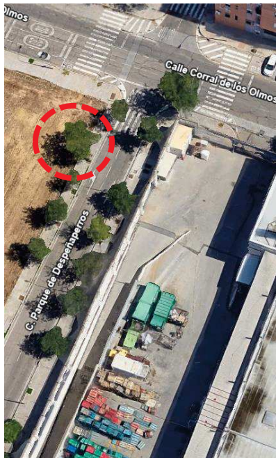
Localización: Robinia pseudoacacia con ID118446 en C/Parque de Despeñaperros, Distrito Norte