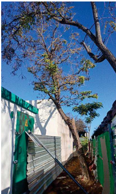
Vista general: decrepitud e inclinación