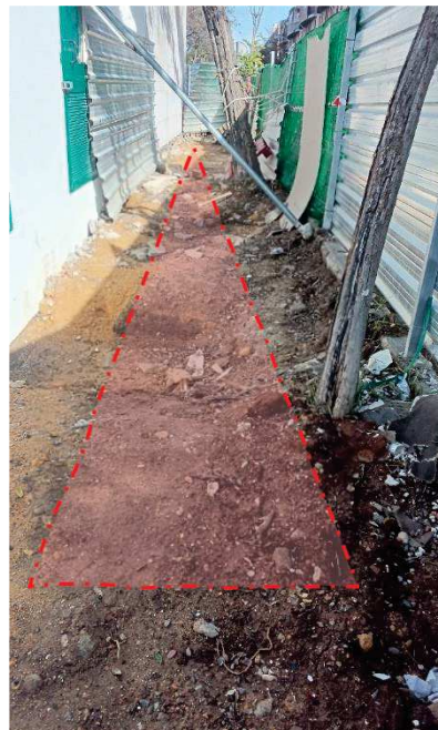
Zona de obras, afectación al sistema radicular.