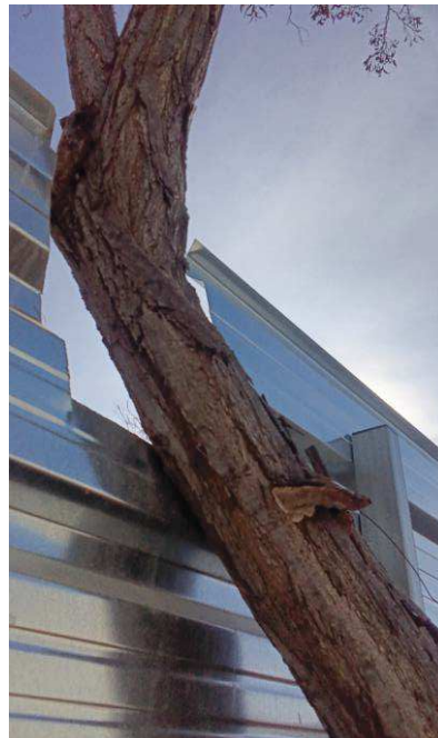
Inclinación. Herida en cruz por eliminación de rama primaria con pudrición. Importante herida longitudinal en la parte a tensión del tronco desde el cuello hasta la cruz con pudrición, cuerpos fructíferos.