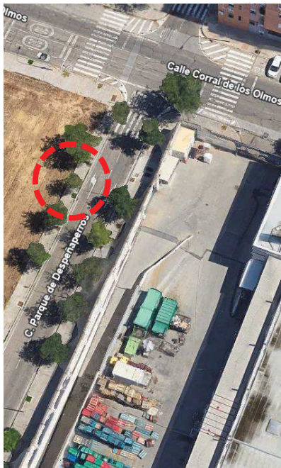
Localización: Robinia pseudoacacia con ID118421 en C/Parque de Despeñaperros, Distrito Norte.