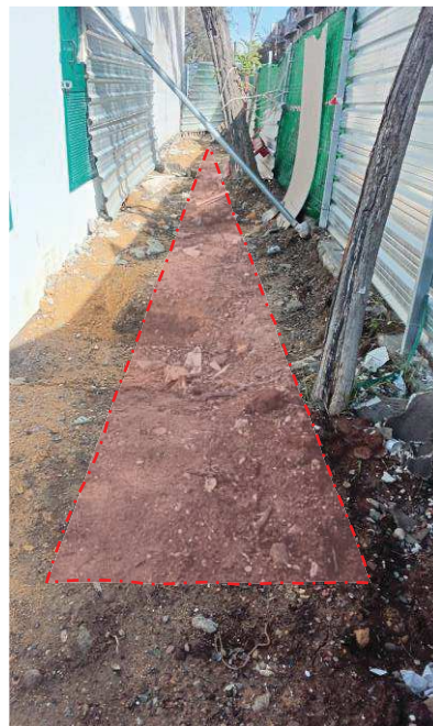
Zona de afectación por obras, posible rotura de raíces.