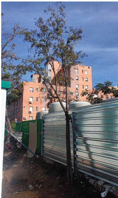
Vista general: desvitalización e inclinación