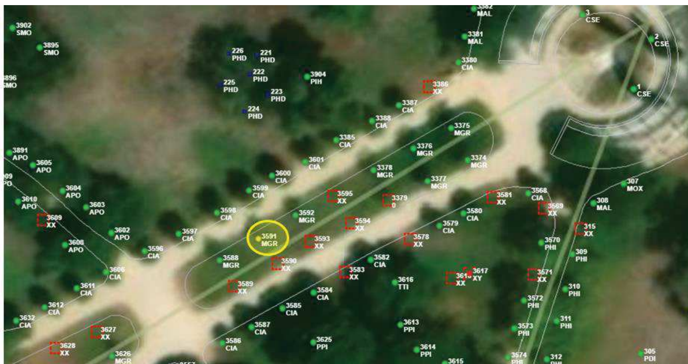
Localización del árbol