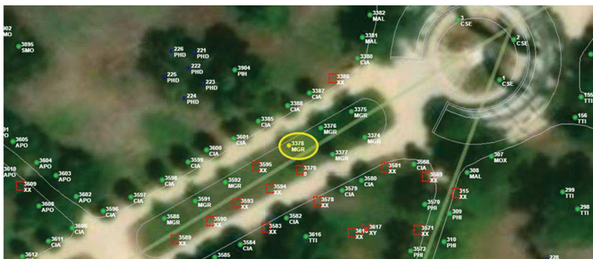
Localización del árbol