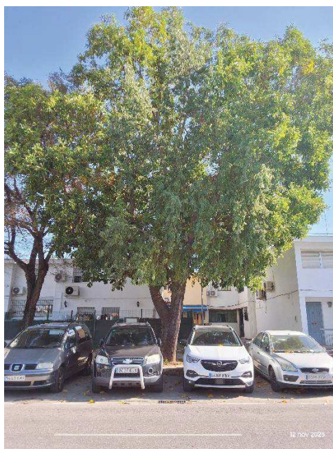
Imagen: BRX 1885.