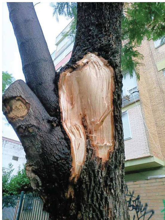
Imagen: Detalle fractura rama insertada en cruz JAM 675.