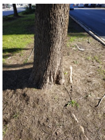
Imágenes del ejemplar con id 24