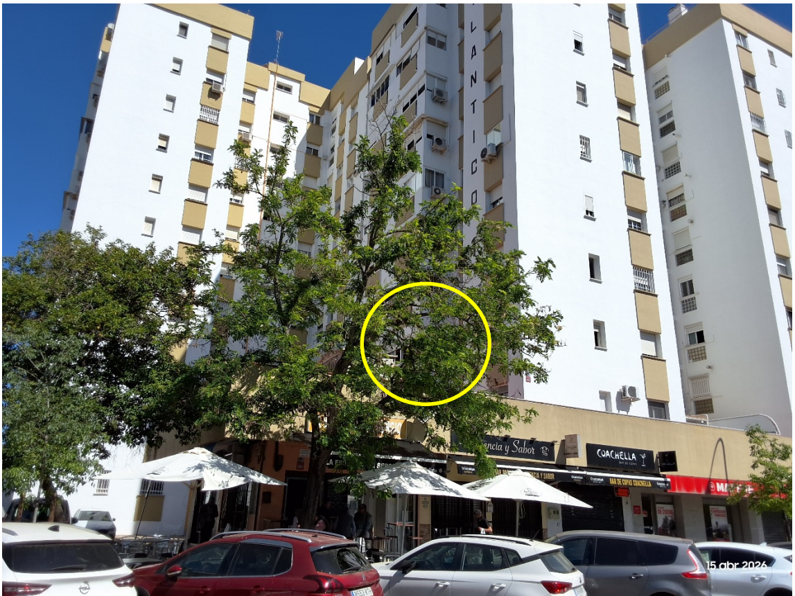
Imagen: RPS 599. En amarillo: rama con la fractura detectada.