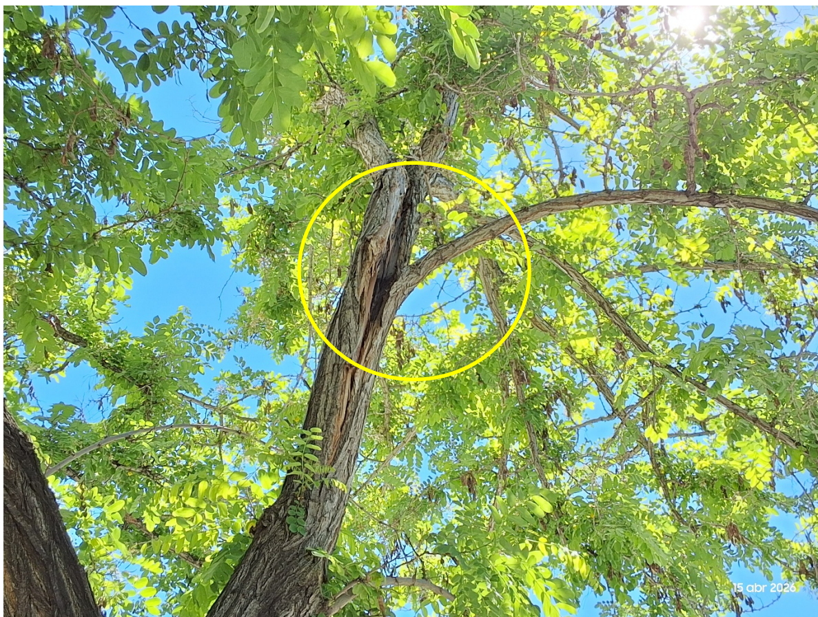
Imagen: RPS 599. En amarillo: fractura en inserción de rama,