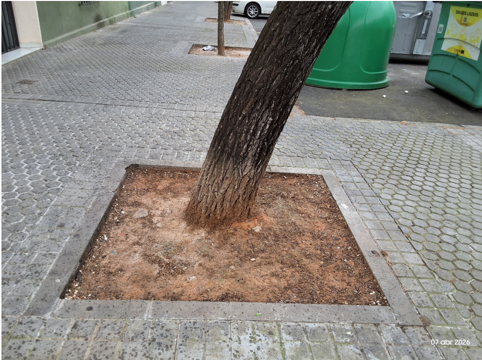
Imagen: UPU 426