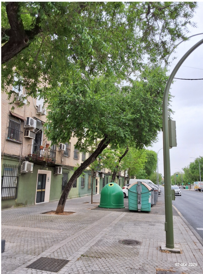
Imagen: UPU 426