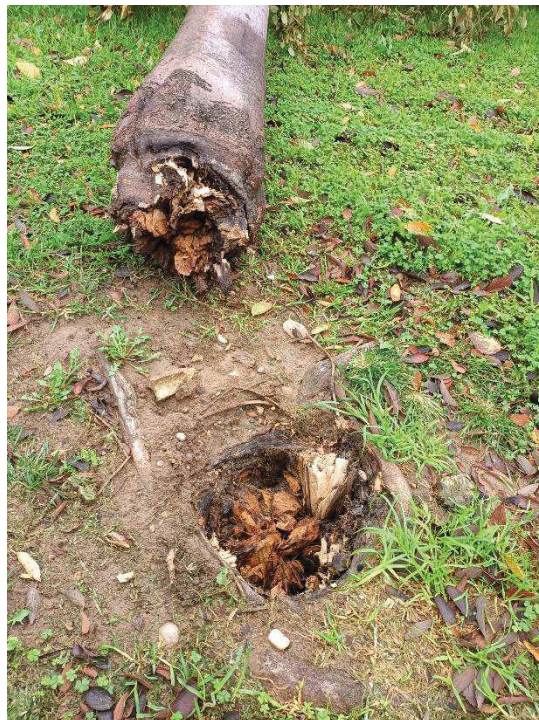
Imagen: detalle del vuelco (1) por rotura de cuello (2).