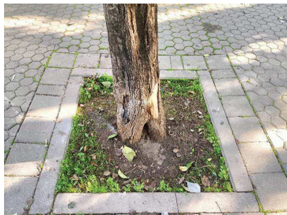
Imagen: LJA 492.