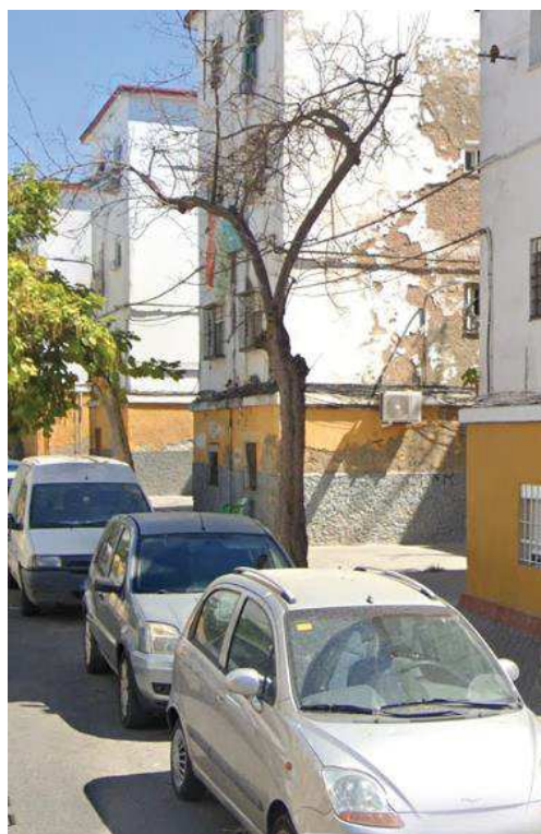
Imagen: CBI 2031 durante el apeo (1), mismo ejemplar en agosto.