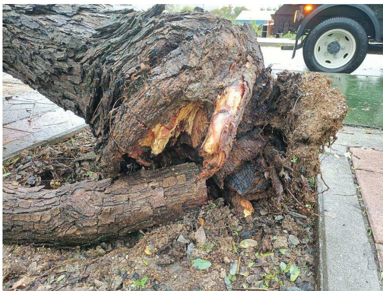
Imagen: TTI 29866.