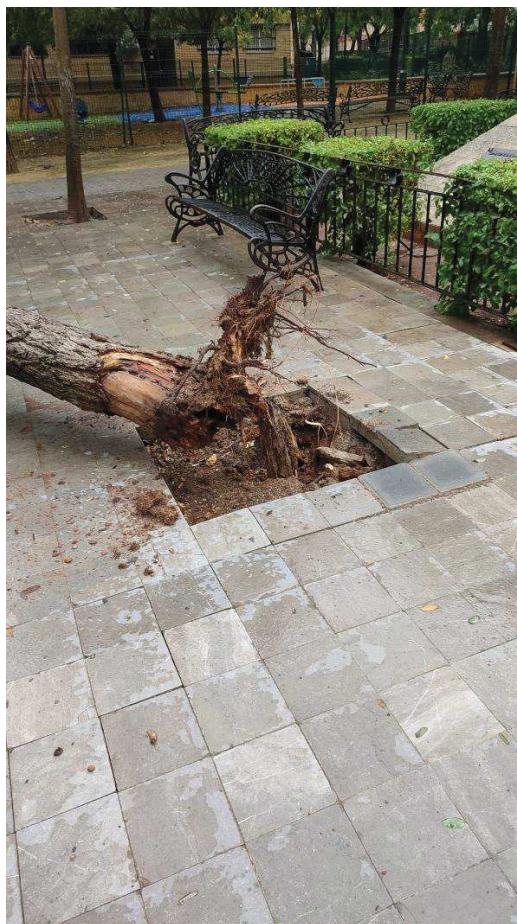
Imagen: Detalle del vuelco (1 y 2).