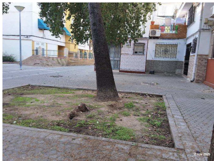
Imagen: BPO 330.