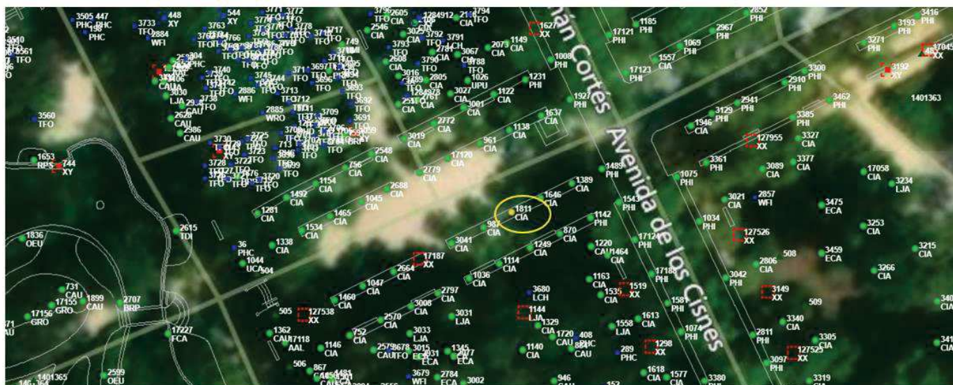
Localización del ejemplar de interés.