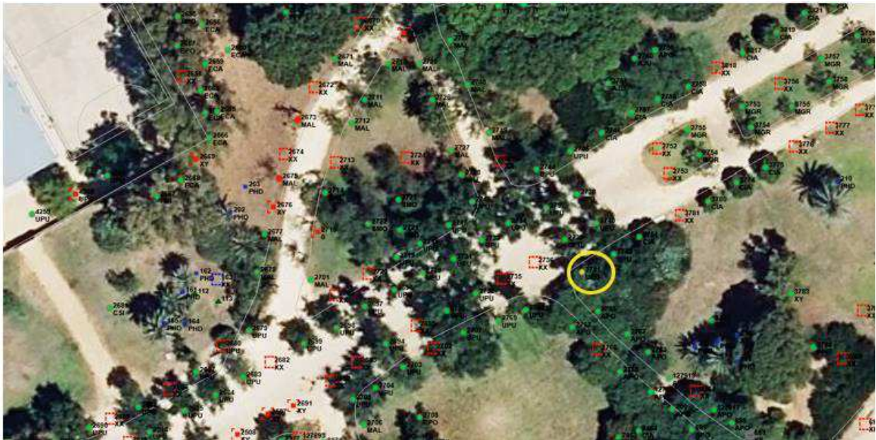
Localización del ejemplar de interés.