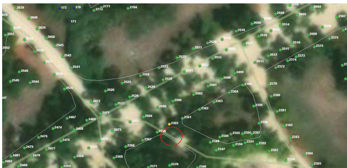
Localización del ejemplar de interés.