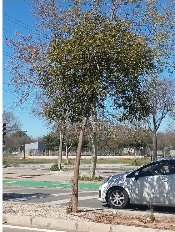
Vista general: árbol desvitalizado, interferencias con vehículos