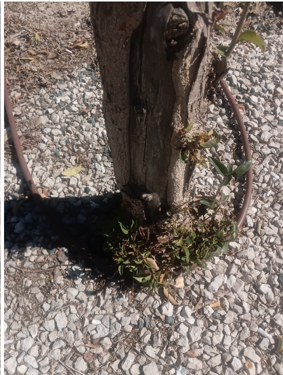
Importante herida longitudinal desde el cuello hasta la mediación del tronco con madera vista/pudrición y pérdida de sección