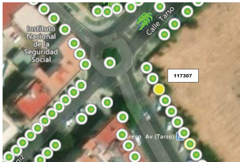
Localización del ejemplar en color amarillo