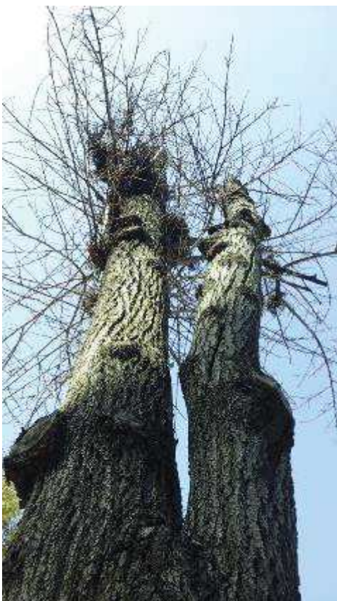
Defoliación y ramas secas superior al 90% de la copa, descortezamiento con fendas verticales, gomosis/exudaciones y cuerpos fructíferos