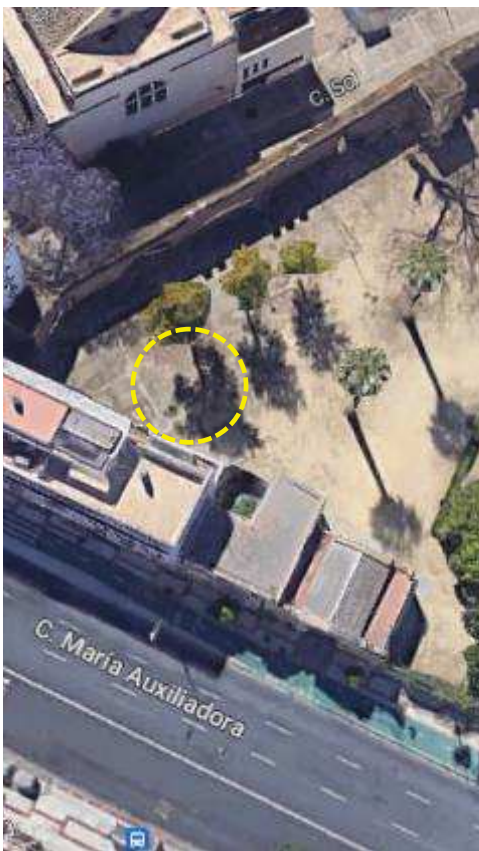
Localización: ID 2, DEL VALLE, JARDINES, distrito Casco Antiguo