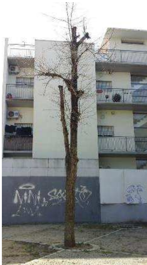
Vista general: árbol seco.