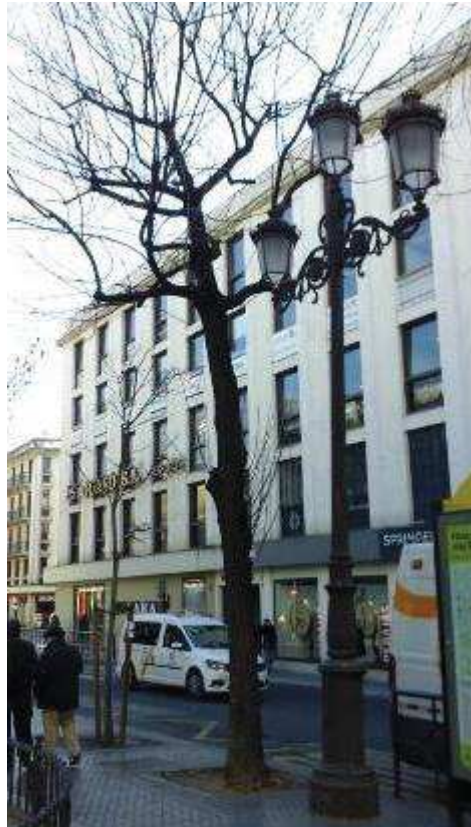
Vista general. Árbol desvitalizado con problemas de adecuación al espacio en un entorno muy exigente: interferencias con farola, intenso tráfico rodado y de peatones.