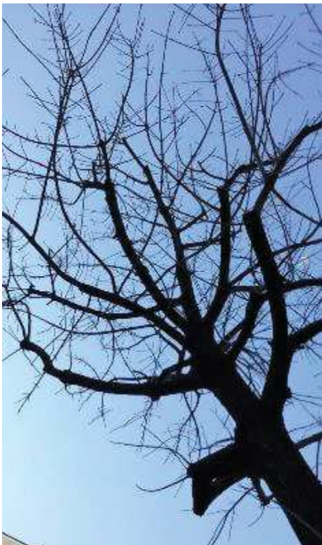
Copa rala, desestructurada y desequilibrada por malas condiciones edafoclimáticas y podas de adaptación al entorno. Baja cobertura.