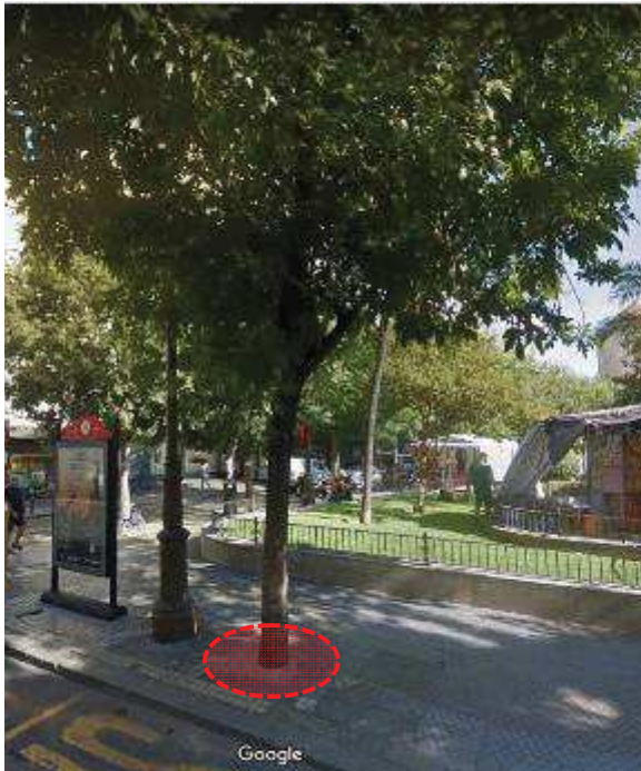
Captura 4. Reducción progresiva del alcorque desde 2012, apareciendo totalmente cegado en agosto del 2016, cuando todavía se aprecia una vegetación aparentemente

Cualquier impedimento al crecimiento secundario de un árbol termina por dañar al cambium que termina por volverse no funcional. Si el daño afecta al 100% de la circunferencia, se produce el “anillamiento” del tronco, rama... dificultándose la comunicación entre las diferentes partes del árbol y por lo tanto el transporte de agua, sales minerales, nutrientes y hormonas. En este caso, la falta de nutrientes unida a la falta de oxígeno producida por la impermeabilización del alcorque, podría estar provocando la muerte del sistema radicular que se constata con un decaimiento generalizado del árbol, tal y como ha venido observando en los últimos años.