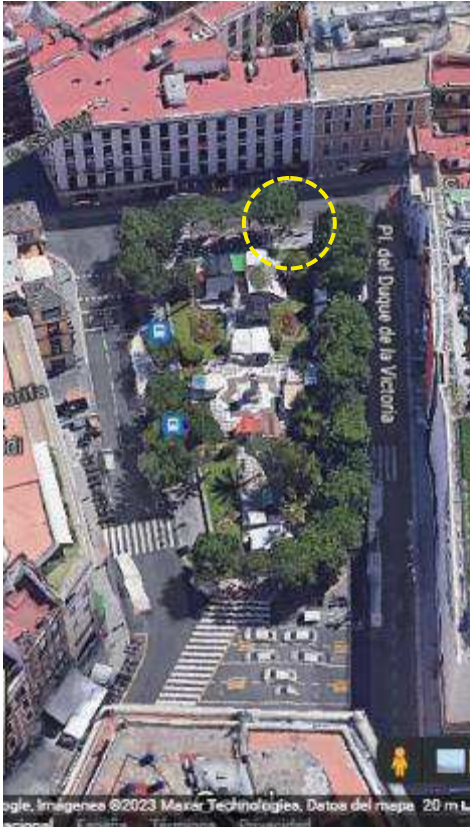
Localización: ID 5, Plaza del Duque, distrito Casco Antiguo