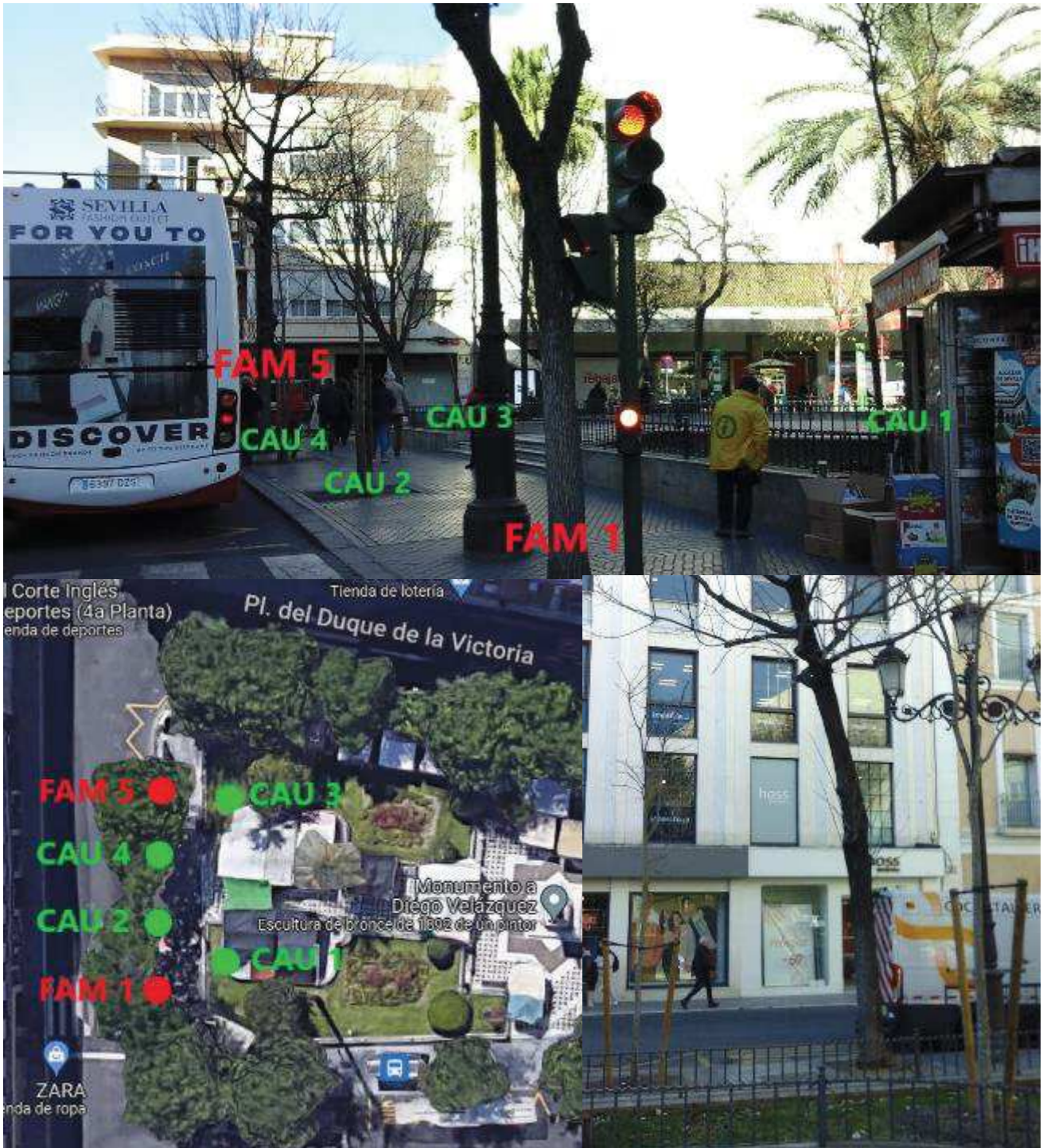
Captura 5 y 6, y foto 7. Nueva plantación de almeces en el otoño del 2022: CAU 1, 2, 3, y 4, dos en el acerado y otros dos en el parterre superior para evitar exceso de pies, pero manteniendo la cobertura vegetal. CAU 3 y 4 a escasos metros de FAM 5

Este ejemplar pertenece a una plantación que se inicia alrededor del 2004 al objeto de renovar otros viejos fresnos americanos existentes en la plaza. Tras constatarse la falta de adaptación de esta especie a este entorno, se decide intercalar almeces en una nueva plantación que empieza sobre el año 2010 y que en el lado sur de la plaza se termina con la eliminación previa de tres ejemplares de fresnos el verano del 2022 y finalmente con la plantación de cuatro ejemplares de almeces en ese mismo otoño, dos de los cuales se sitúan a escasos metros del árbol en estudio.