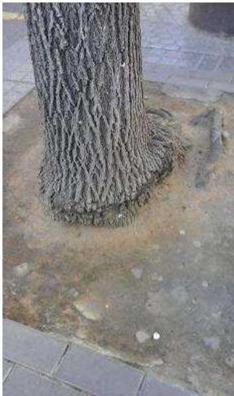
Estrangulamiento del cuello/base del tronco por adoquinamiento del alcorque. Miriñaque y migración de raíces. Posible pudrición de cuello.