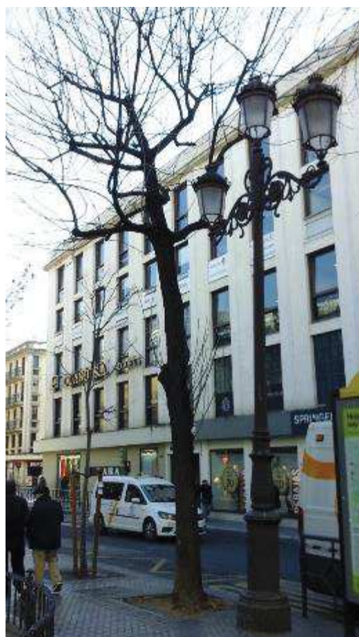
Captura 2. Enero 2023: Vista general. Intenso uso del espacio circundante.