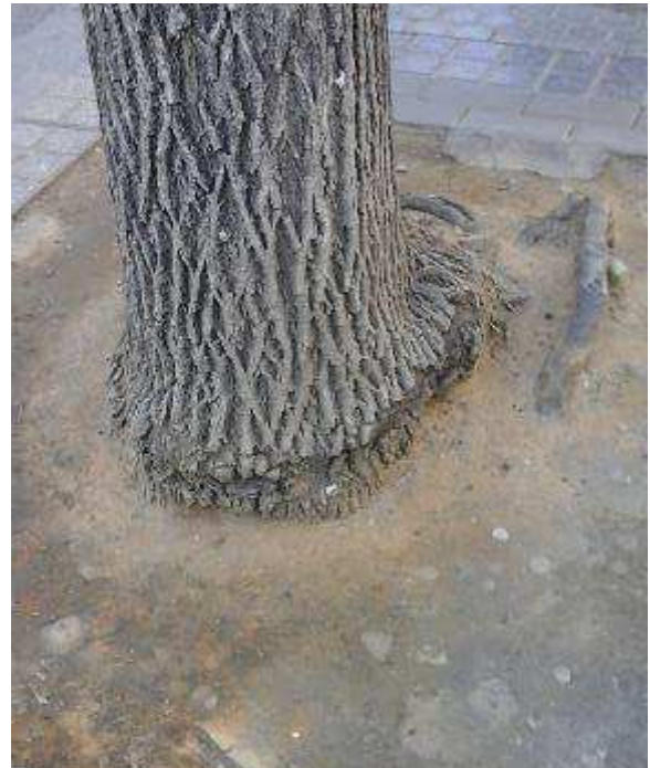
Foto 3. Enero 2023: alcorque liberado de adoquines de granito y cemento: miriñaque -estrangulamiento y posible anoxia radicular. Migración de raíces.

El árbol en un intento de sortear el obstáculo, desarrolla en la parte superior donde se acumula los nutrientes un “labio” de crecimiento al que se le denomina “miriñaque”, y además emite nuevas raíces pretendiendo sustituir al sistema radicular que moribundo se pudre y puede provocar a medio plazo un fallo del árbol por caída rotacional.