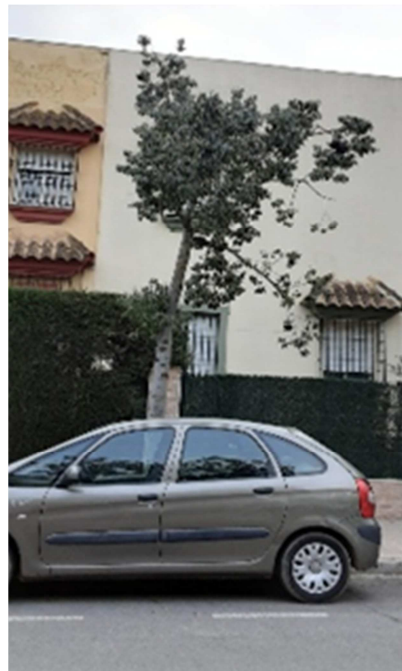
Vista del árbol ENERO 2021