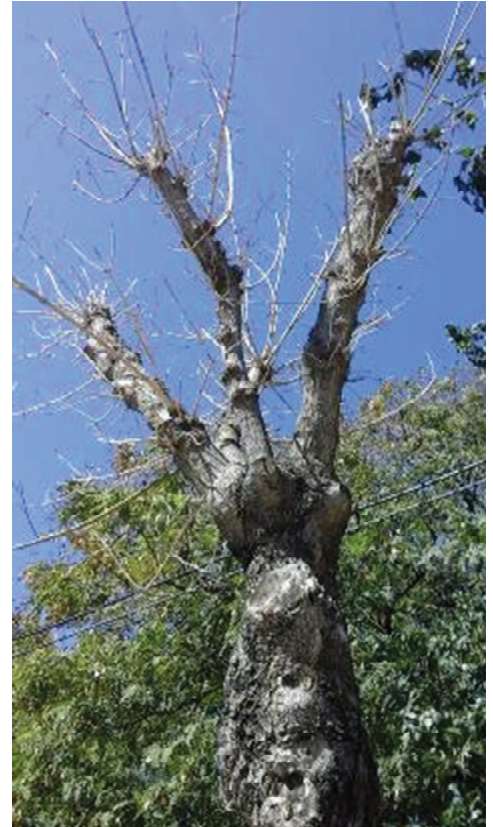
Detalle de la brotación del año anterior totalmente seca.