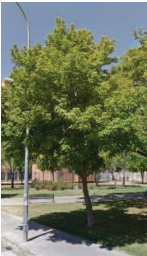
Árbol vigoroso en junio/2014.