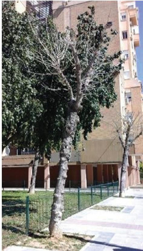
Árbol seco tras repetidas podas de reducción de copa y refaldeo, y diversas obras en su entorno.