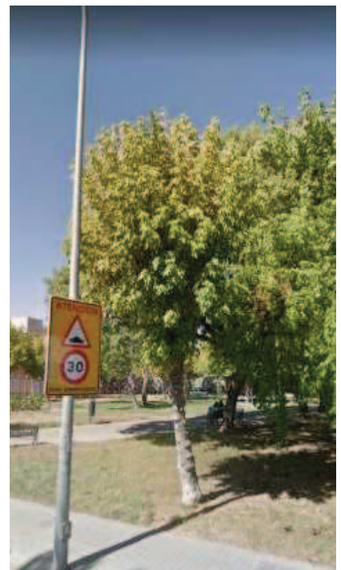
Árbol desvitalizado en septiembre/2017.