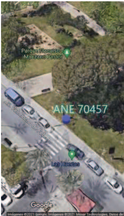
Localización: Parque Fco manzano Pastor (Avda Veintiocho de Febrero -Las Huertas-).