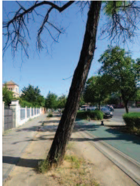
Vista de 90% de copa muerta e inclinación 18° sobre carril bici