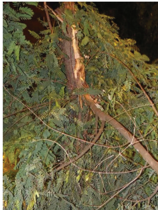
Vista del desgarró del eje principal