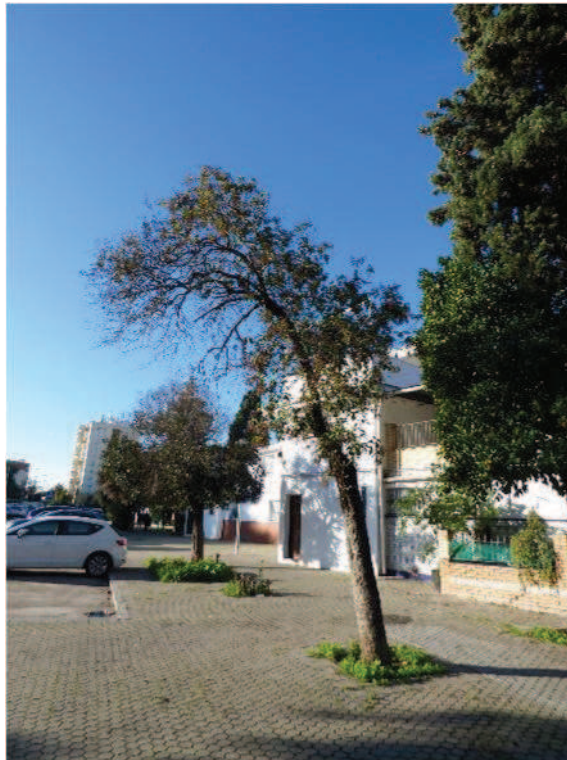
Avda. de Moliní 4 (Pabellón Marroquí) 41012 Sevilla Teléfono 95 54 73232