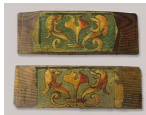
Piezas restauradas de un artesano