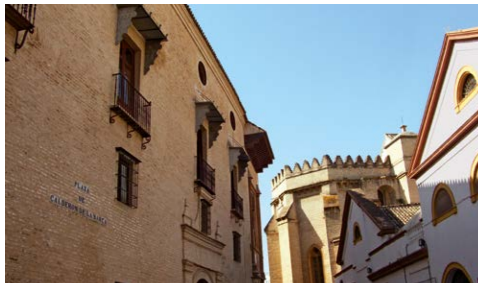
A principios del siglo XVII se abrieron sus cinco grandes balcones, cuyo aspecto general sería bastante más compacto en la fachada principal sita en la Plaza Calderón de la Barca