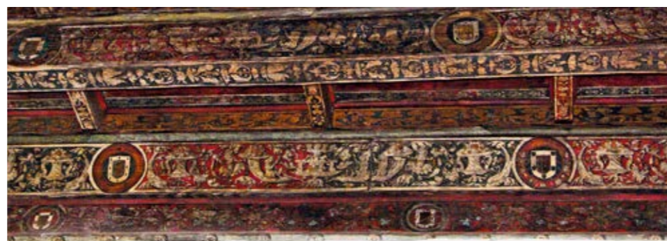
Techo policromado de la sala Doña Leonor, detalle