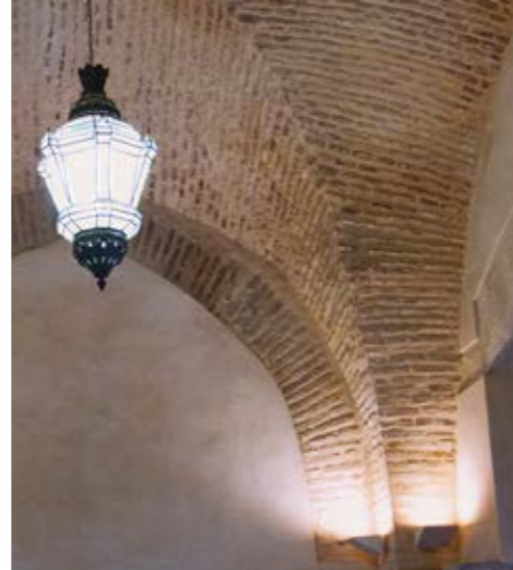
Desde su portada gótico-mudéjar se accede a un amplio vestíbulo abovedado