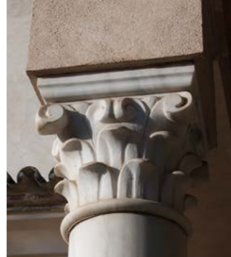
Capitel de una columna del patio central, detalle