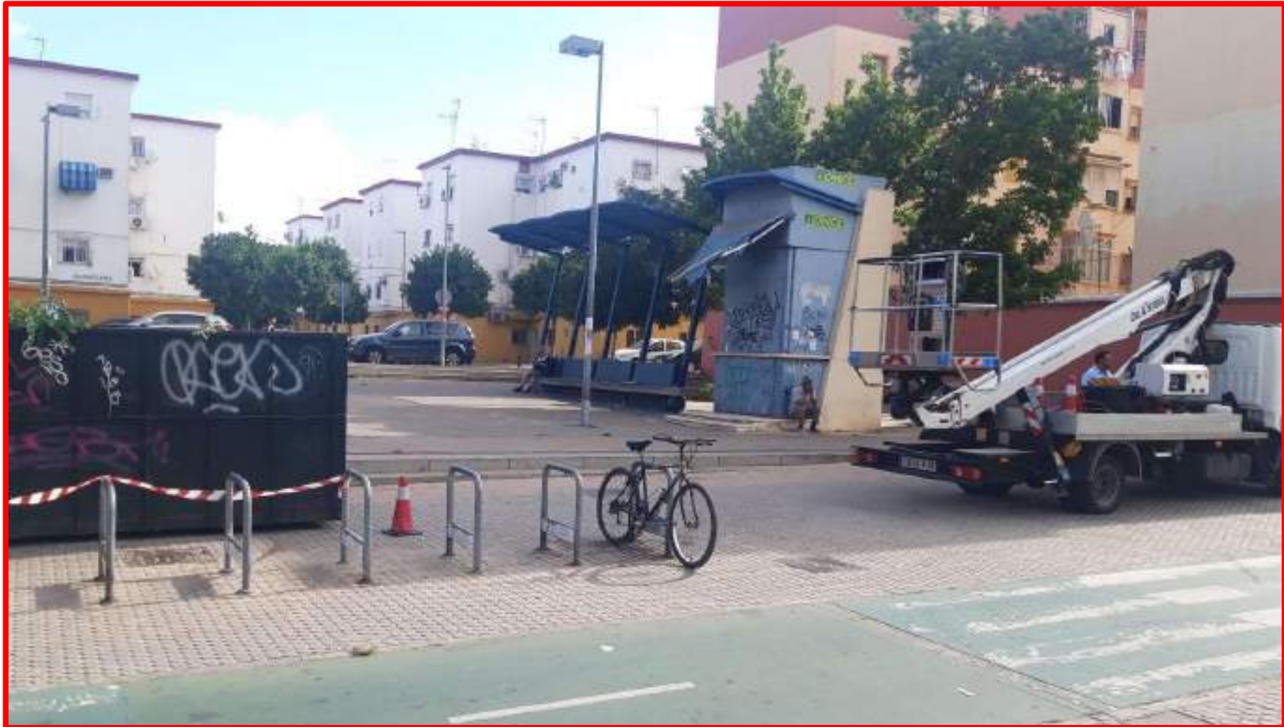
Poda Plaza Real Patronato de Casas Baratas