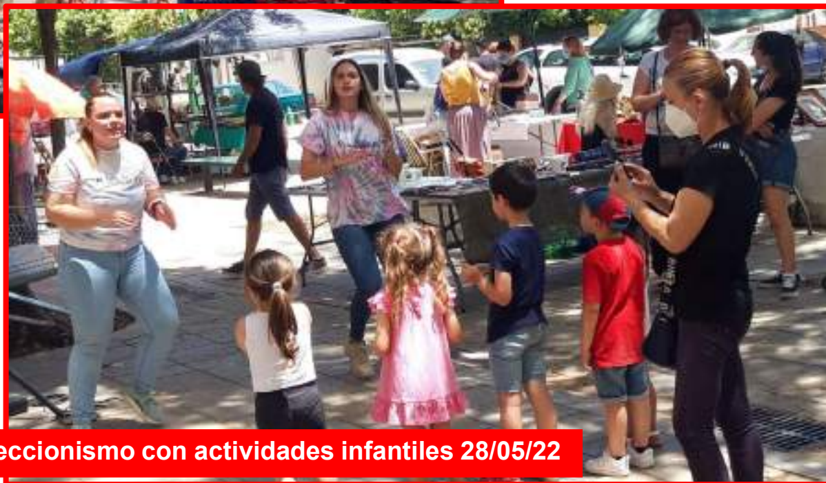
III Feria del Coleccionismo con actividades infantiles 28/05/22