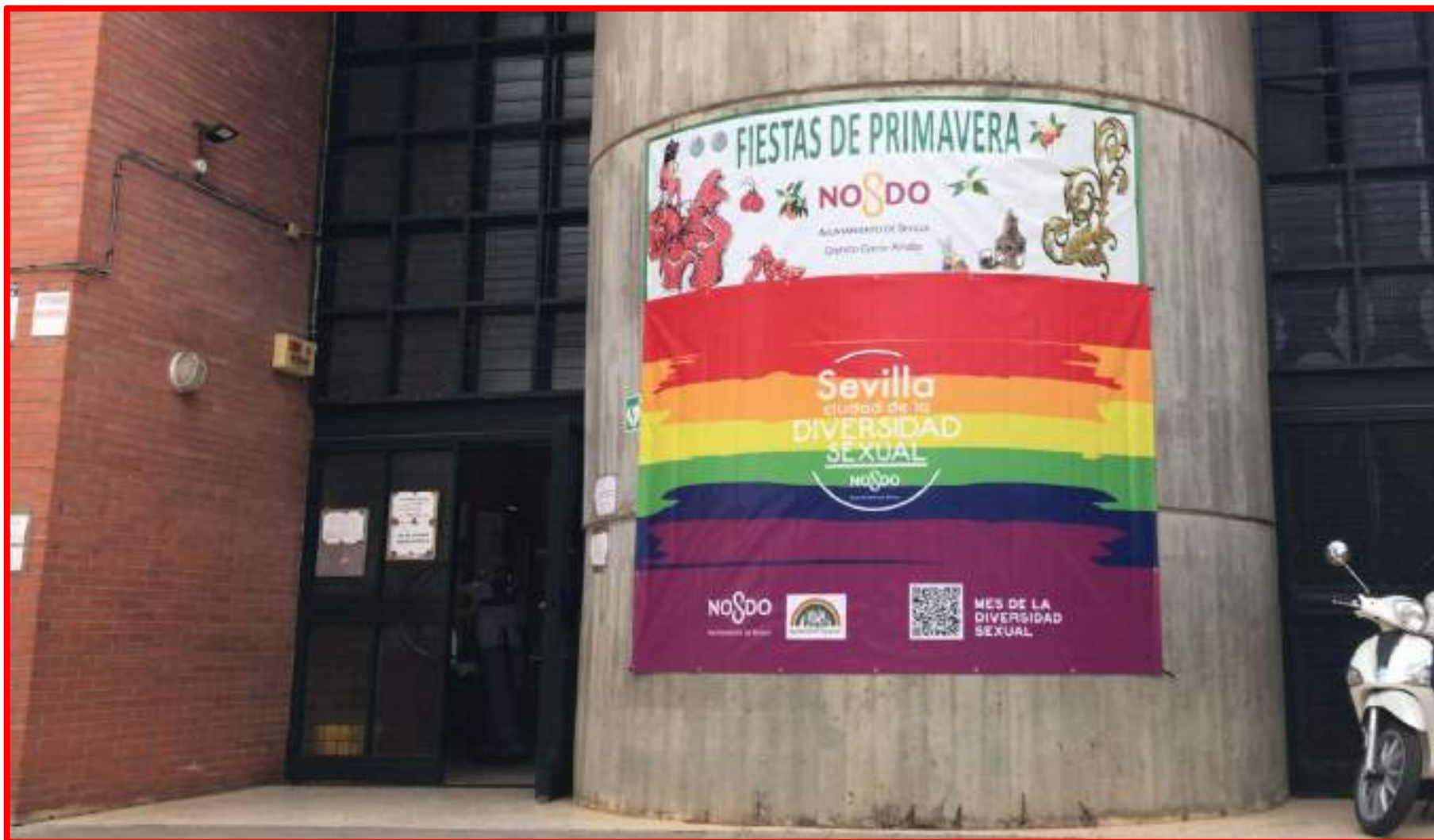
Colocación cartel mes Orgullo LGTBI en sede Distrito