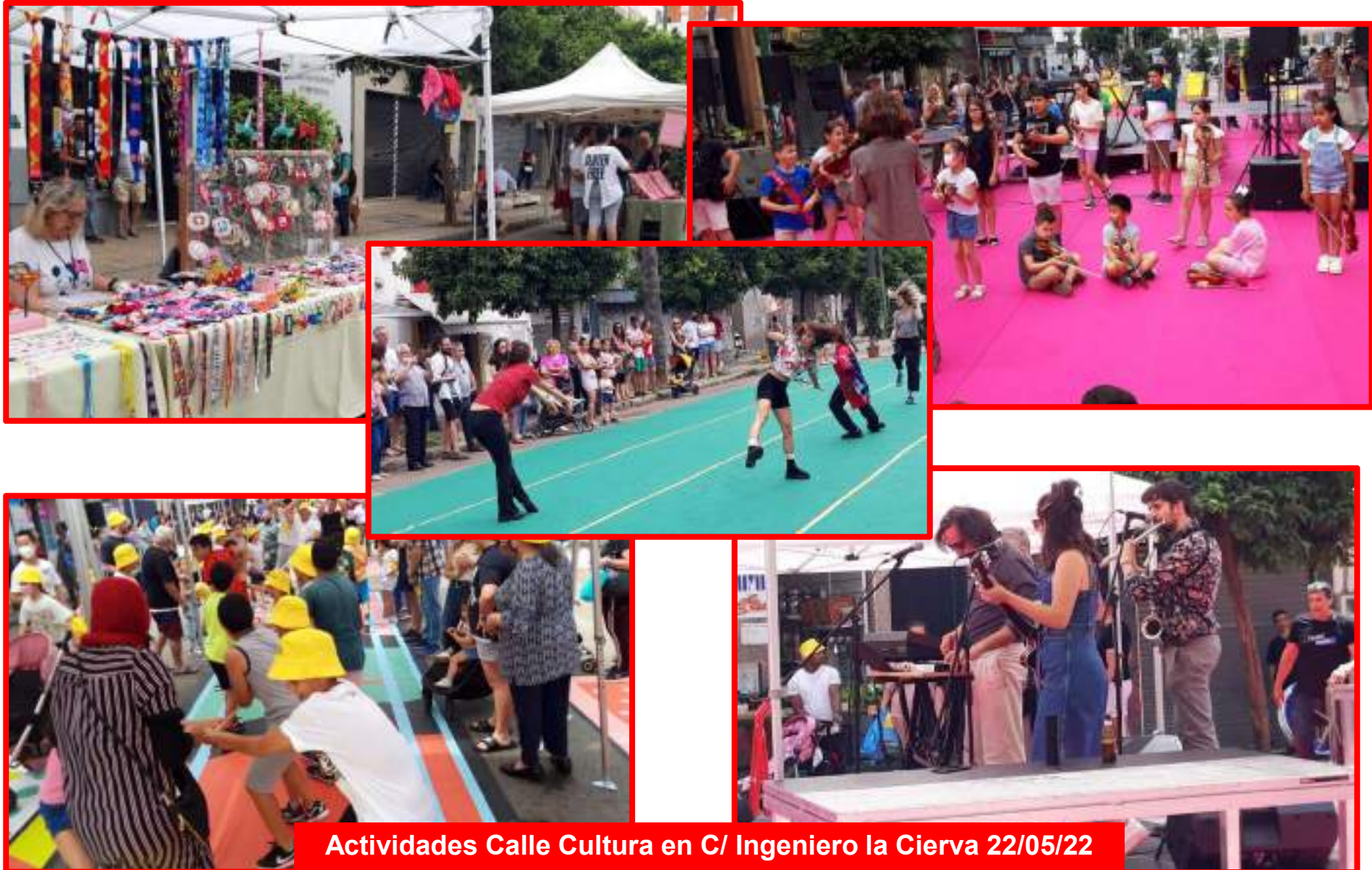
Actividades Calle Cultura en C/ Ingeniero la Cierva 22/05/22

ICAS Instituto de la Cultura y las Artes de Sevilla NO8DO AYUNTAMIENTO DE SEVILLA