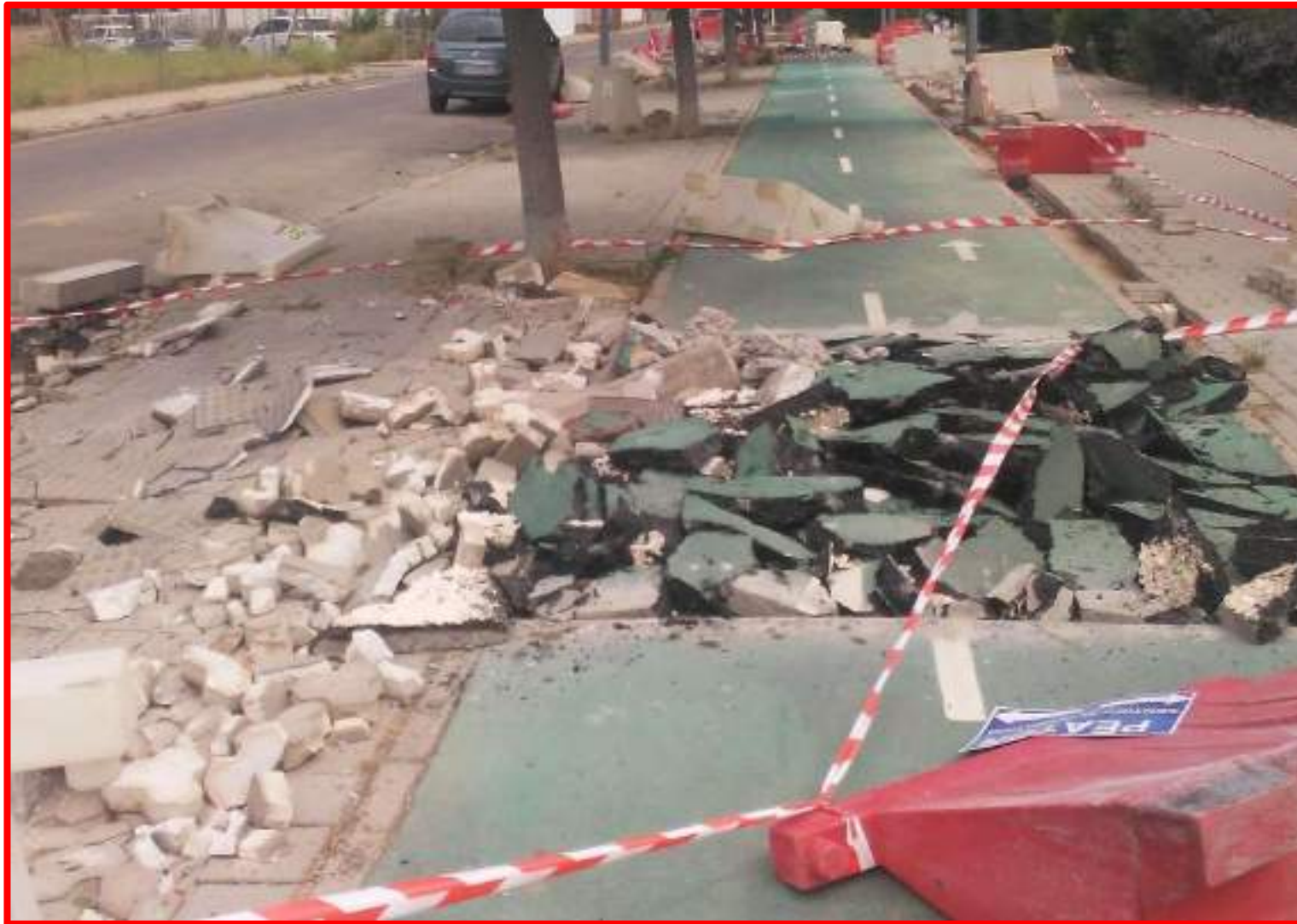
Reparación carril bici C/ Loja