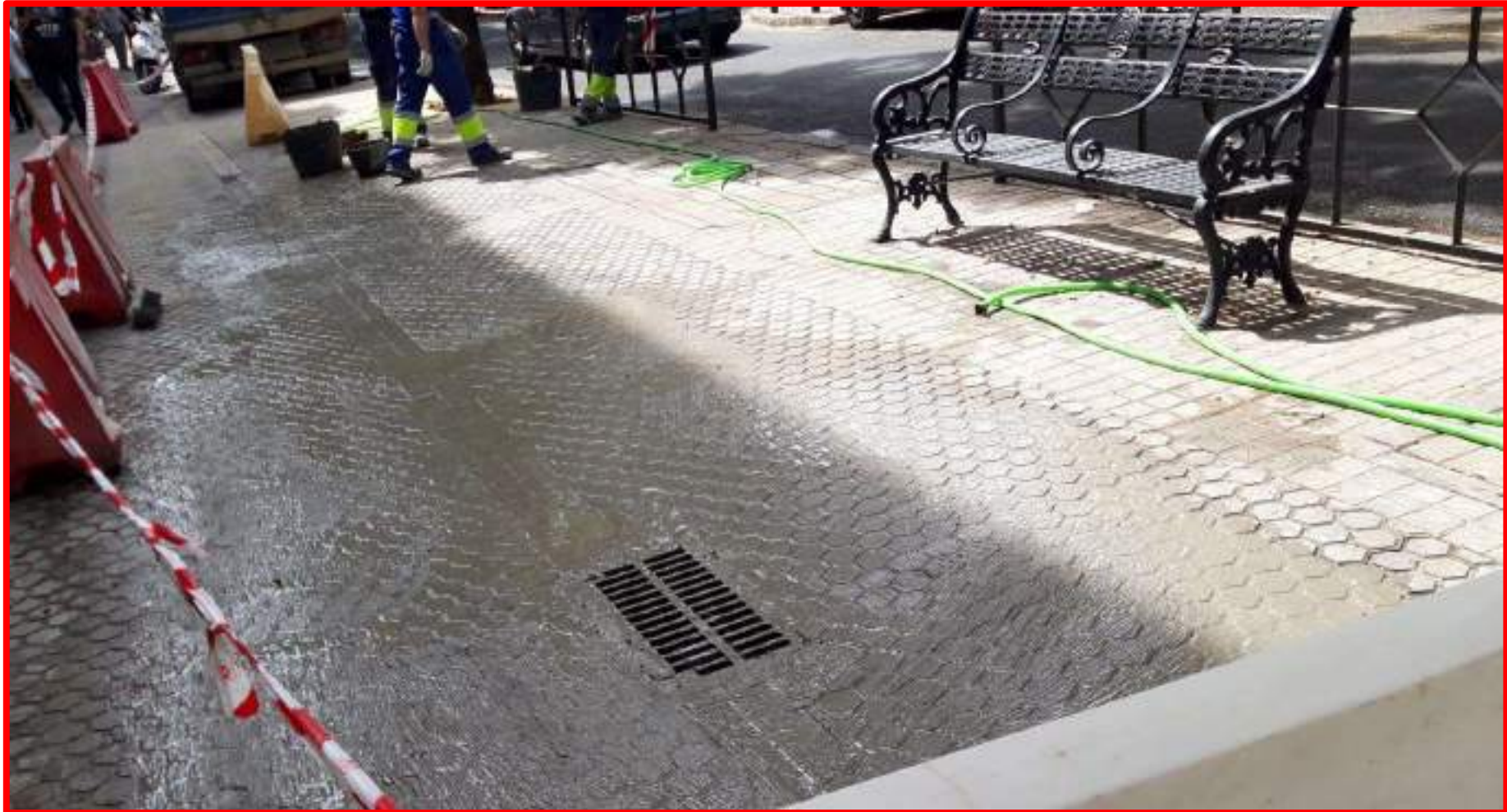
Reparación acerado C/ Afán de Ribera, junto a Colegio Ruiz Elías