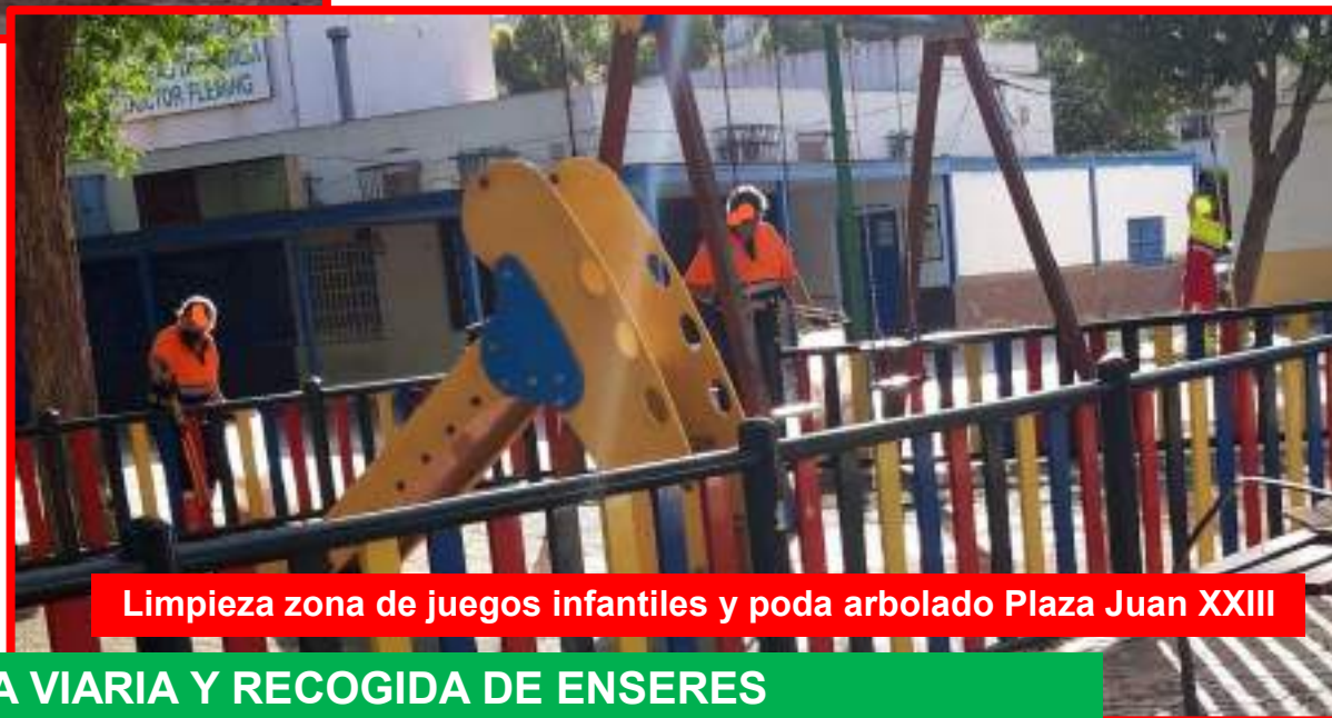
Limpieza zona de juegos infantiles y poda arbolado Plaza Juan XXIII