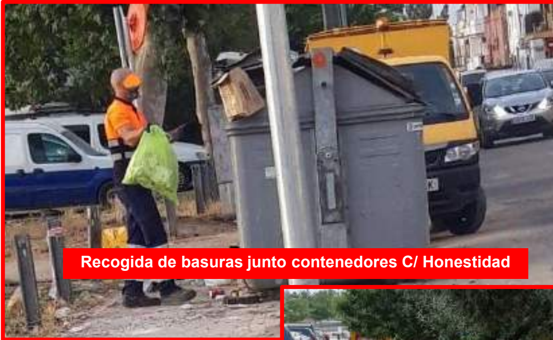
Recogida de basuras junto contenedores C/ Honestidad