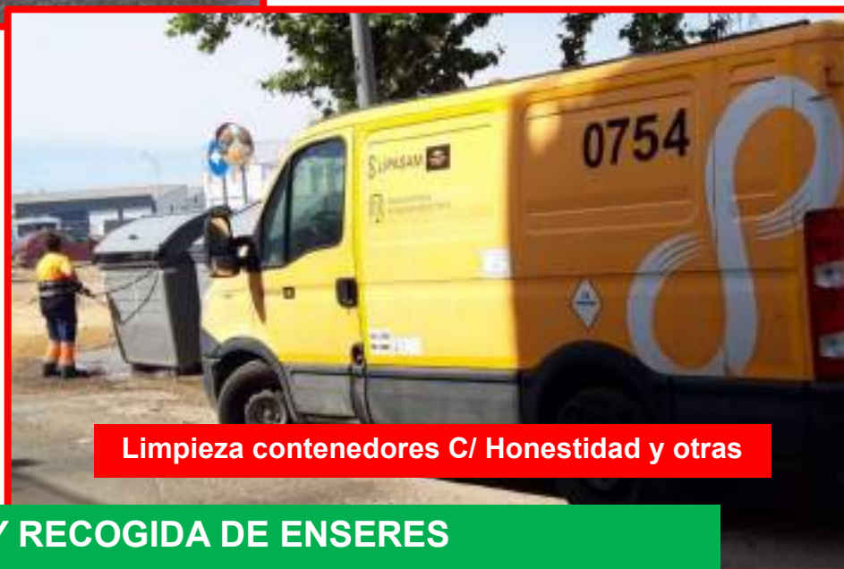
Limpieza contenedores C/ Honestidad y otras