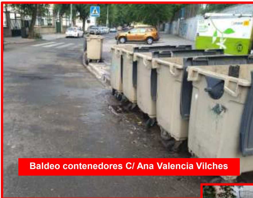
Baldeo contenedores C/ Ana Valencia Vilches