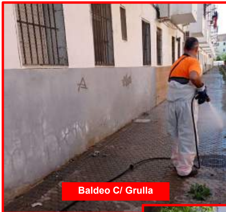
Baldeo C/ Grulla