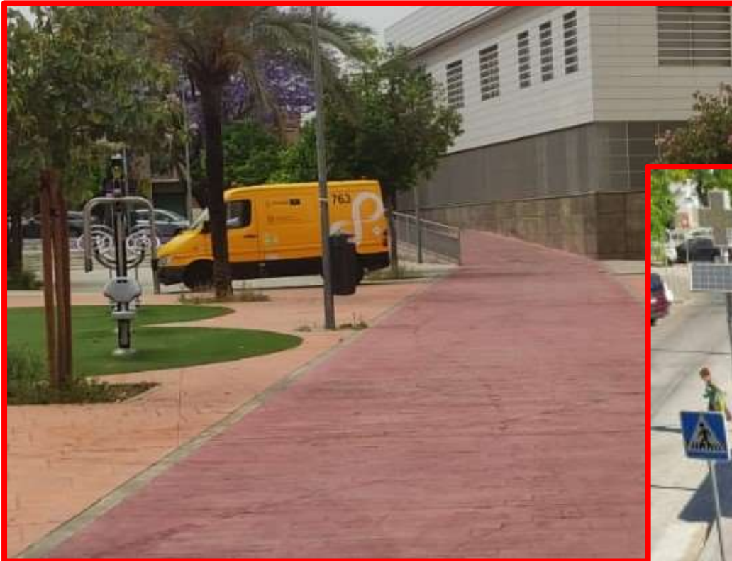
Limpieza C/ Petrarca