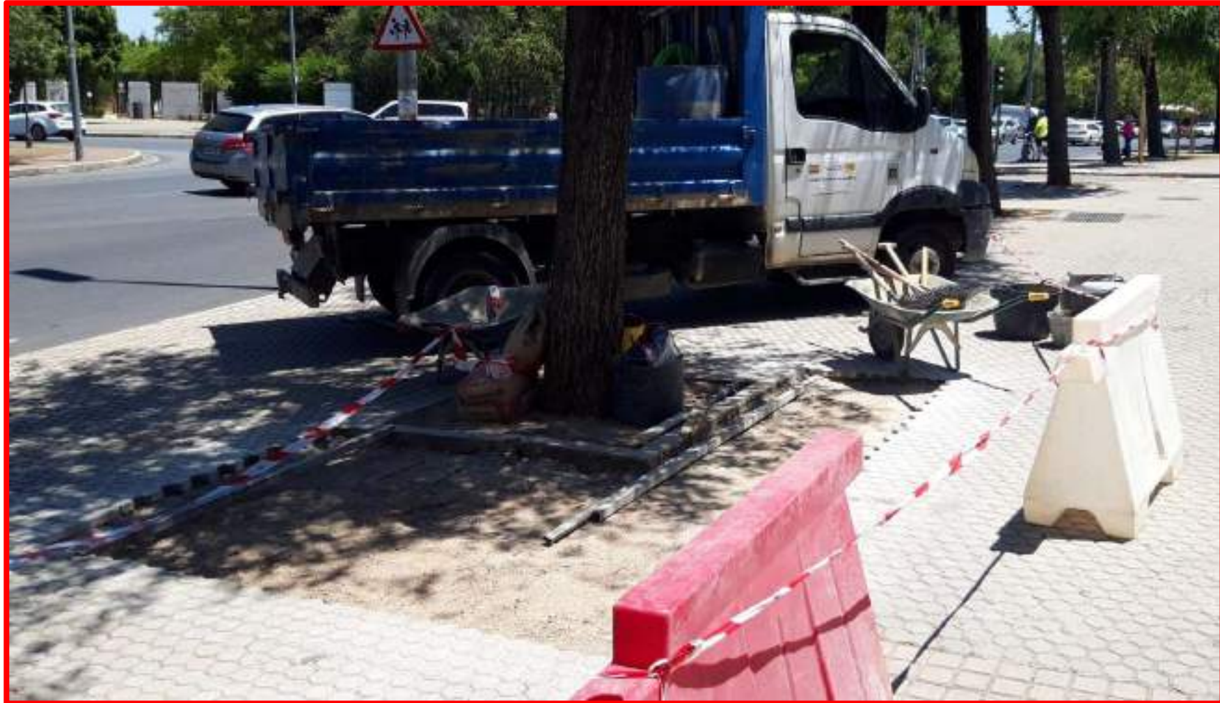
Arreglo acerado y alcorques Avda. Juan XXIII