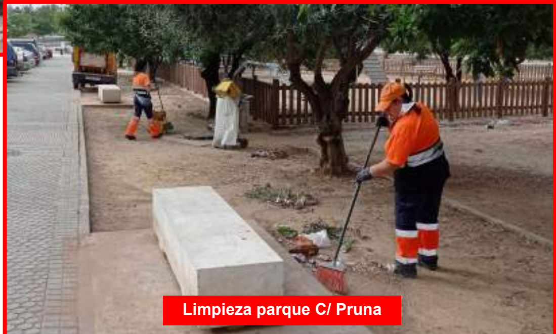
Limpieza parque C/ Pruna