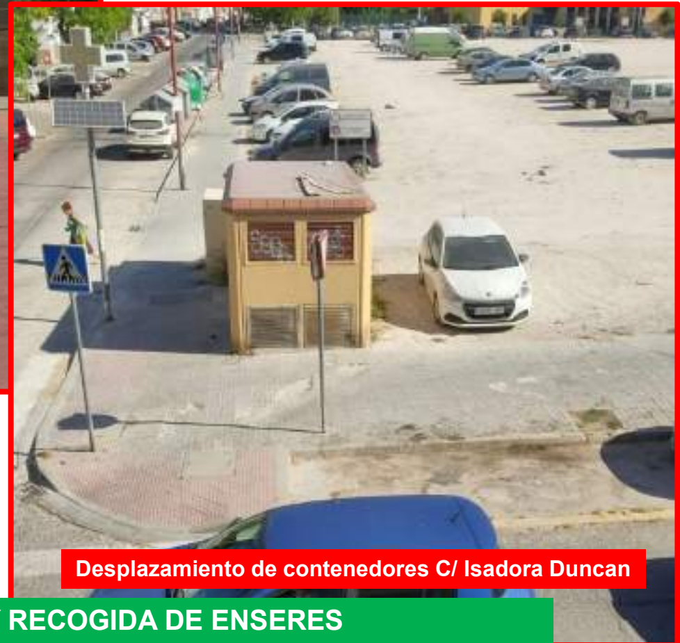
Desplazamiento de contenedores C/ Isadora Duncan