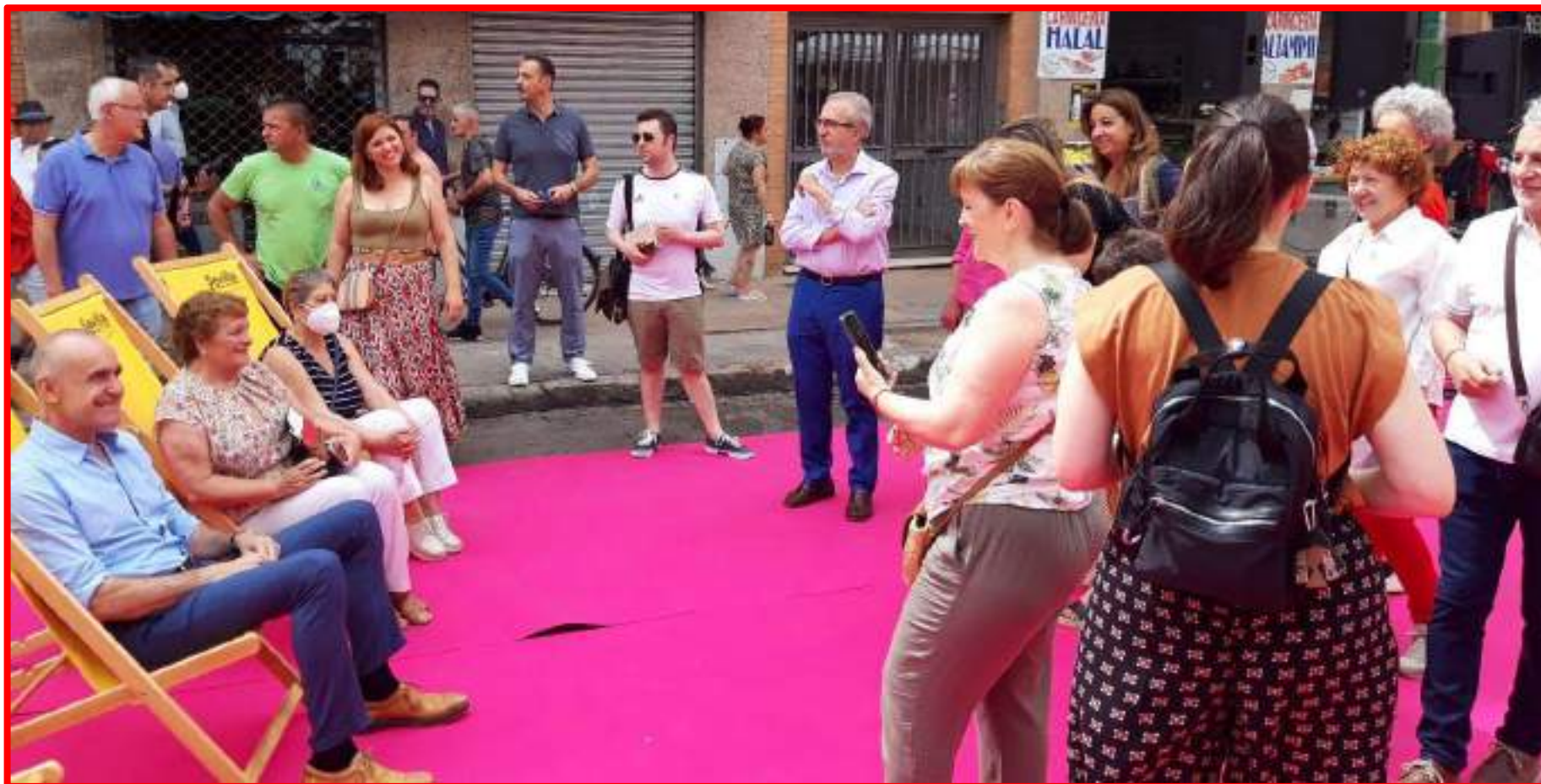
Asistencia Alcalde actividades Calle Cultura en C/ Ingeniero la Cierva 22/05/22