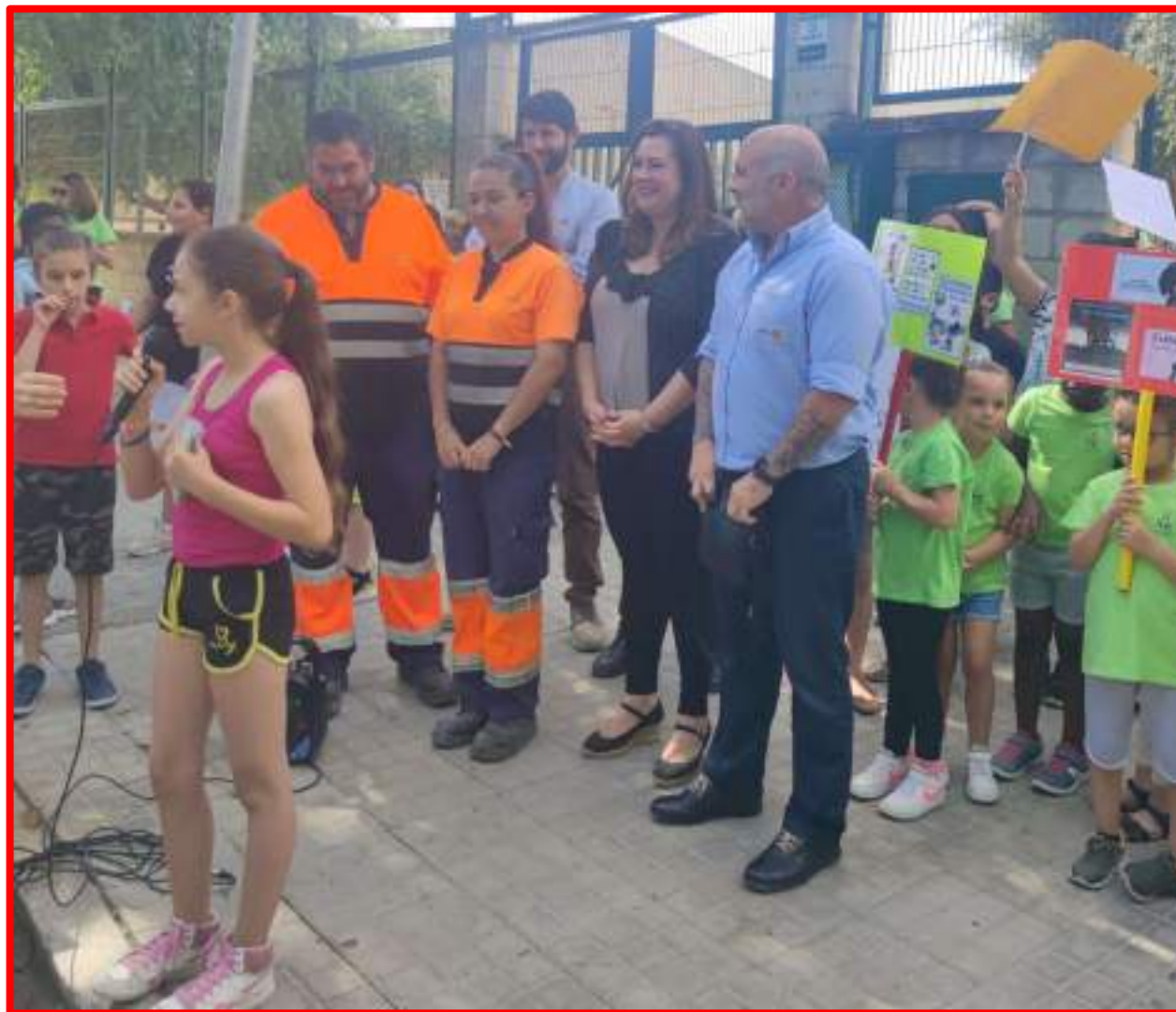
Actividad Lipasam en C.E.I.P. Adriano del Valle con Delegada de Limpieza Viaria 03/06/22