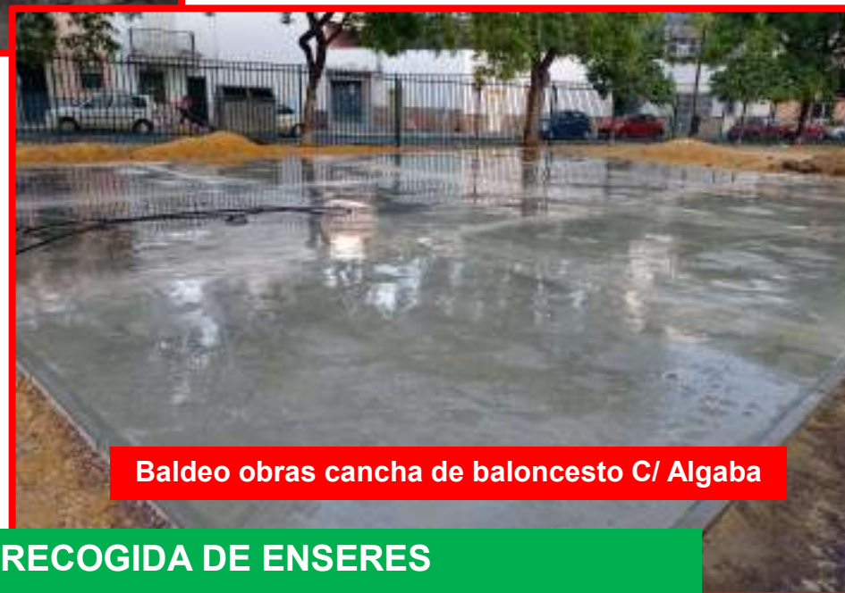
Baldeo obras cancha de baloncesto C/ Algaba