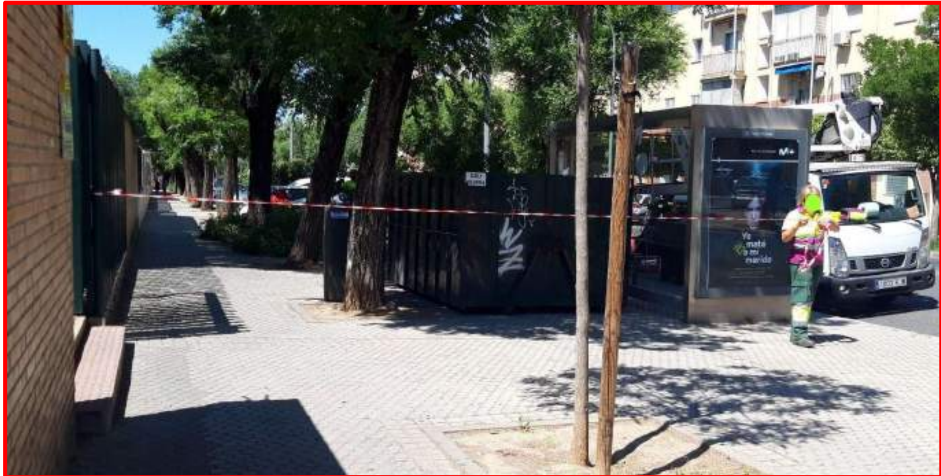
Poda arbolado Avda. San Juan de la Cruz