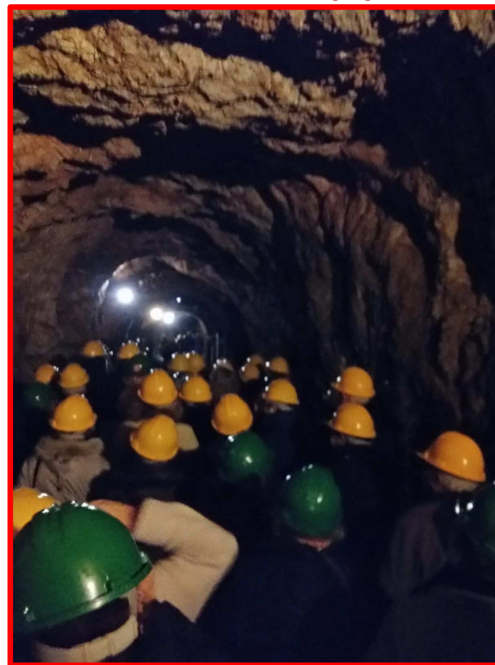
Visita a Minas de Río Tinto 15/03/18