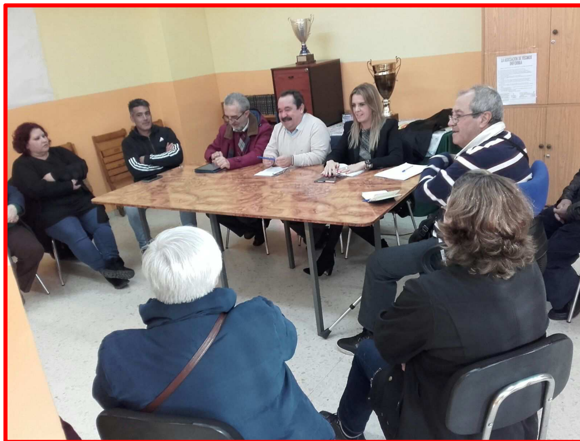
Reunión con AVRA y Coord. Asociaciones Palmete 20/03/18