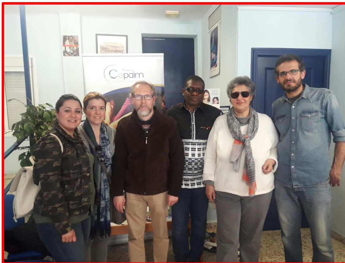
Convivencia intercultural en Fundación CEPAIM 27/03/18