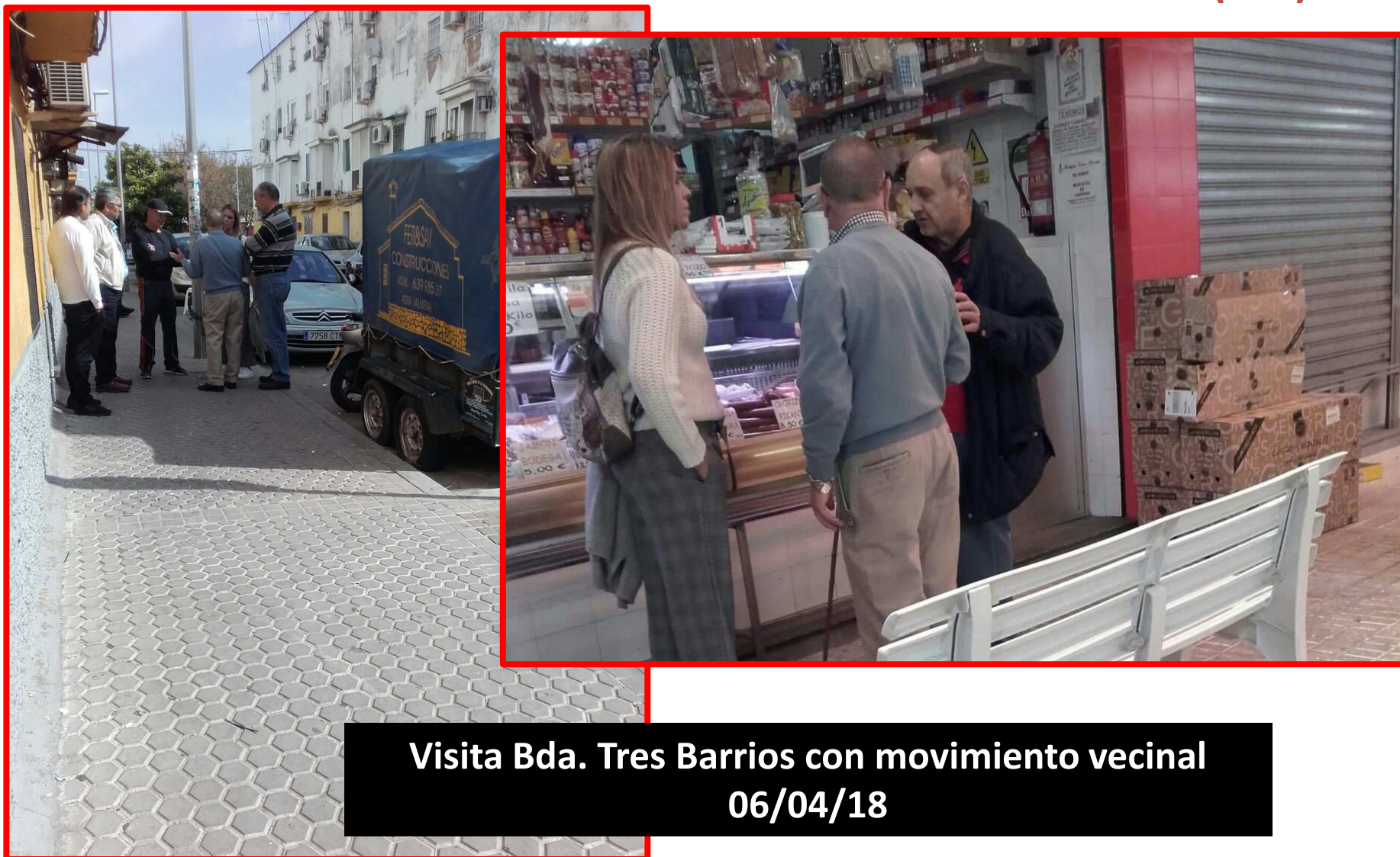
Visita Bda. Tres Barrios con movimiento vecinal 06/04/18